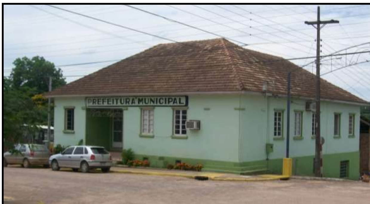
PREFEITO MUNICIPAL ELOMAR ROCHA KOLOGESKI

PROJETO DE LEI Nº 001/20 Altera carga horária, padrão e as atribuições do cargo de Assistente Social – 40 horas do quadro de servidores efetivos do Poder Executivo e dá outras providências. APROVADO 10/01/2020.